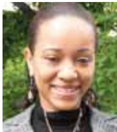
Rêve Manon Réceptionniste